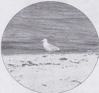
Möwe an der Ostsee